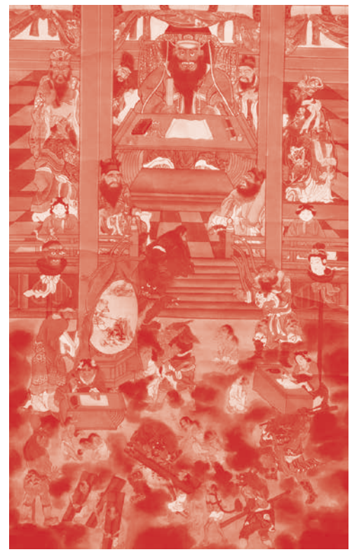
六道絵通坊本 閻魔王宮幅(部分、正興寺(通坊)蔵)