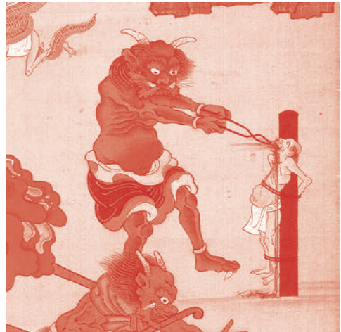
立山曼荼羅大仙坊A本 大叫喚地獄の場面(部分、芦峯寺大仙坊蔵)