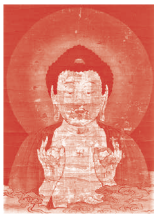
山越阿弥陀図(部分、光照寺蔵)