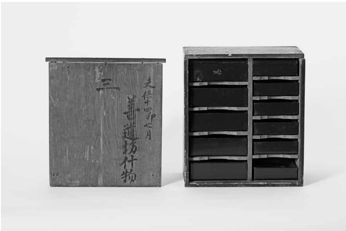
写真6 ちかむかえべんとうばこいれ (当館蔵、国指定重要有形民俗文化財・資料番号498)