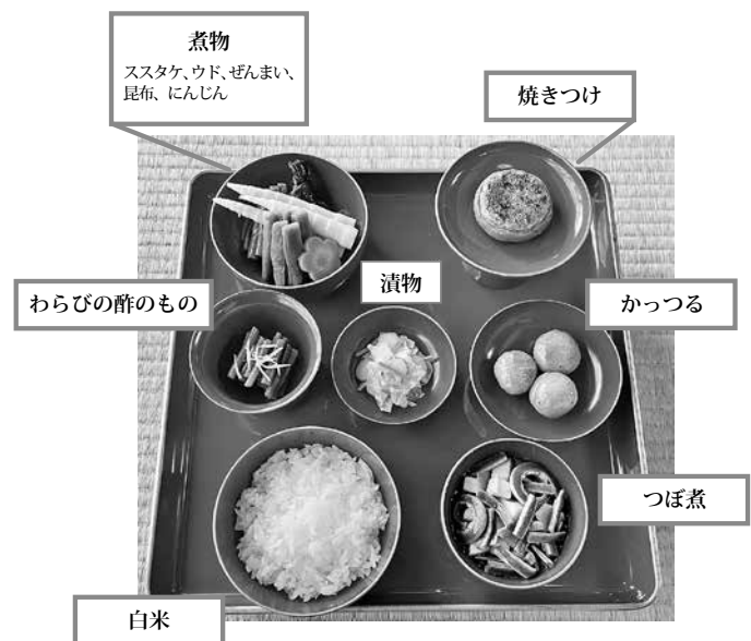
図1 芦峯御膳の一例 (教算坊で展示中の食品サンプル)

本稿では、芦峯寺集落に伝わる話と聞き取り調査の成果をまとめ、江戸時代に立山へ訪れた人々の記録と併せて考察したいと思う。