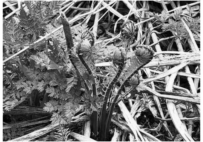
写真8 芦峯寺で採れるクゴミ