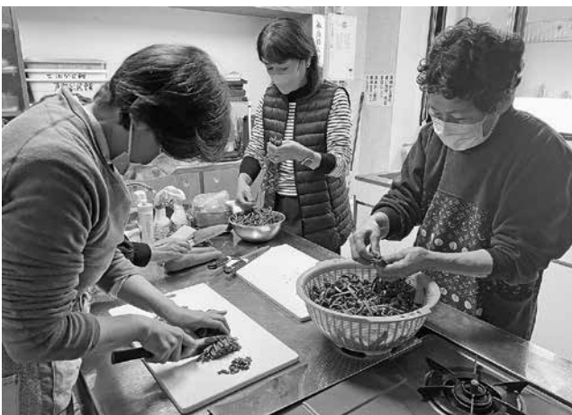
写真11 クゴミを揃えて切る