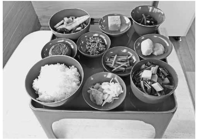
写真10 まんだら食堂の芦峯御膳