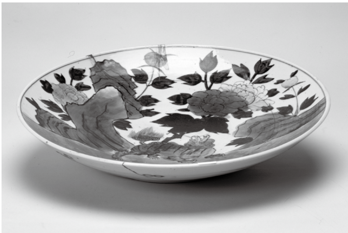
写真4 とつべざら (当館蔵、国指定重要有形民俗文化財・資料番号415)