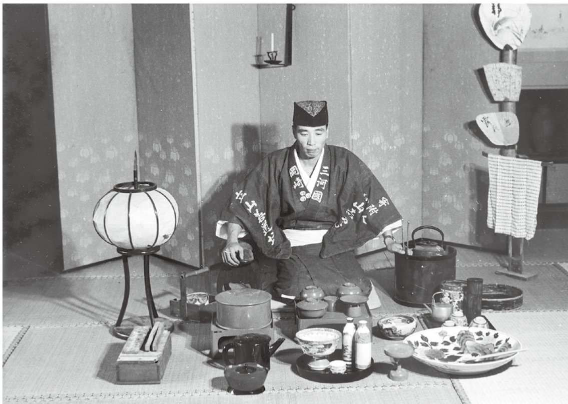
写真3 道者衆への接待 (昭和43年の調査報告の再現写真より)