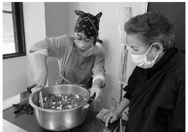
写真12 クゴミと里芋・人参を炒める