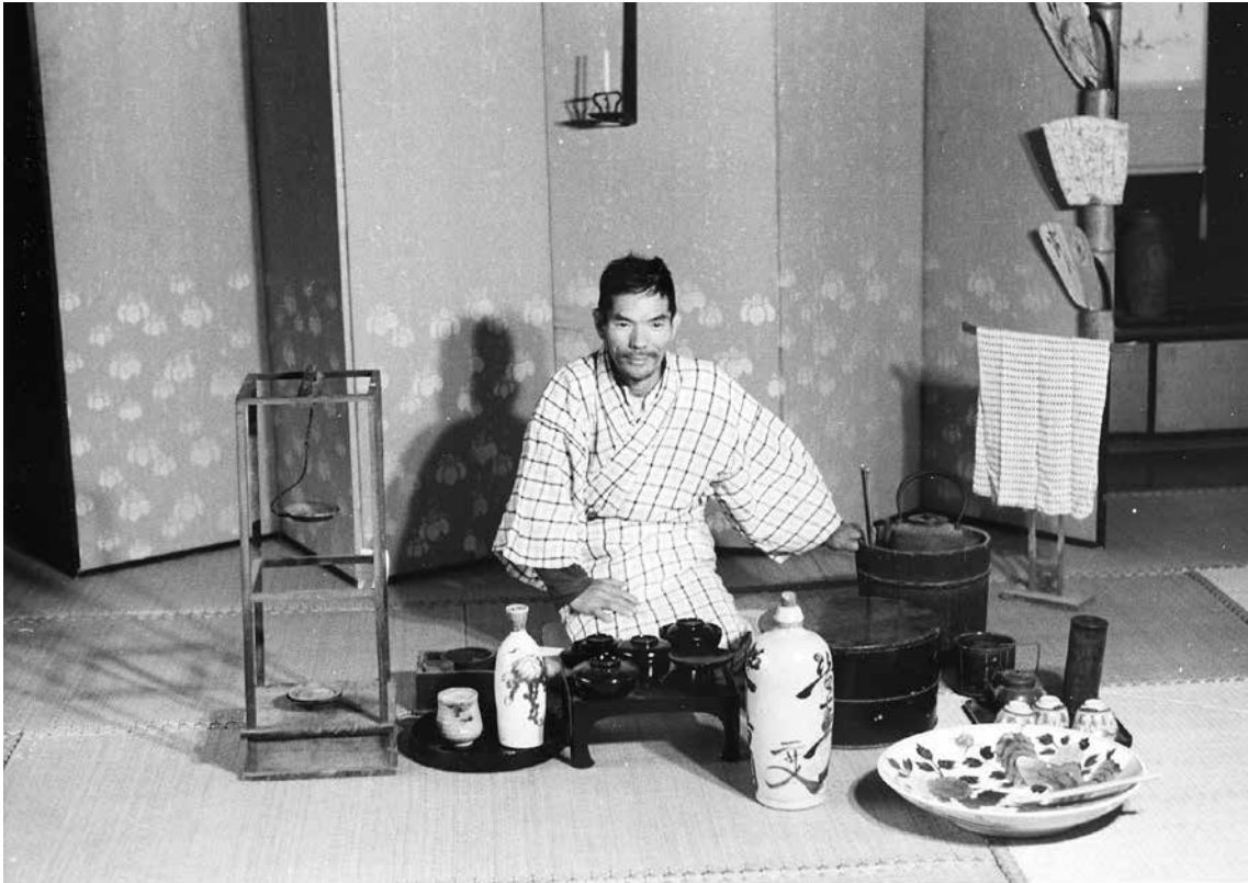
写真5 参連衆への接待 (昭和43年の調査報告の再現写真より)