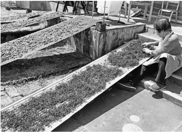
写真9 クゴミを乾燥させる