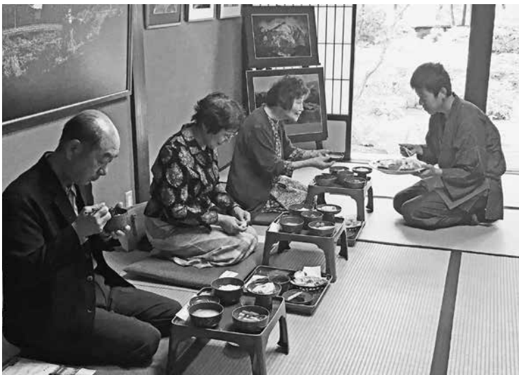
写真1 「坊家御膳の再現」の様子 (富山県文化振興財団主催イベント)