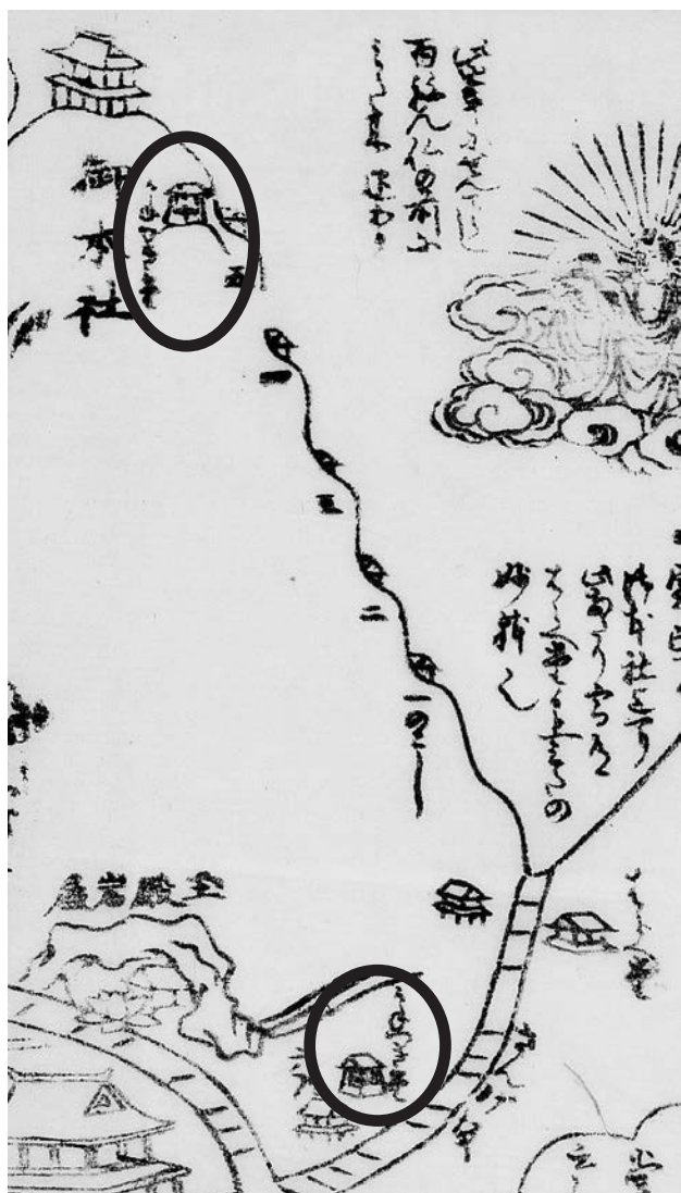
写真2 「越中国立山禪定名所附図別当岩嶽寺」(当館蔵)より部分 囲み部分2箇所（雄山頂上御本社下、懺悔坂の右側）に「かねつき（鐘撞）堂」が見える。