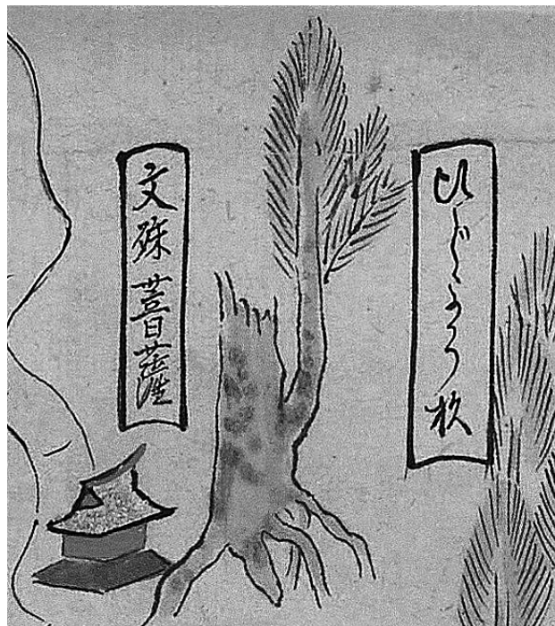
写真1 「立山曼荼羅立山博物館H本」(当館蔵)より部分 「びじよう杉」と名付けられた杉(美女杉)が切株から新たな幹や葉を茂らせている。