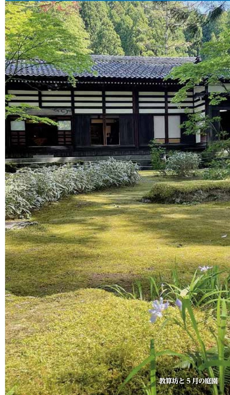
教算坊と5月の庭園